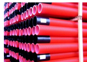
Tubo PE 2WW N450 em vara vermelha

O nosso Departamento da Qualidade está ao dispor para qualquer esclarecimento.